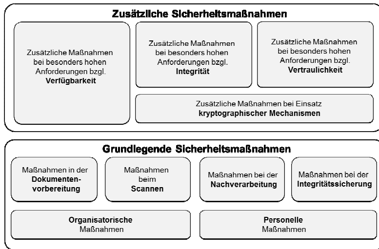
Abbildung 2: Der modulare Maßnahmenkatalog im Überblick

Um diesen Risiken entgegen zu wirken, wurden entsprechende technische und organisatorische Sicherheitsmaßnahmen festgelegt, die den identifizierten Gefährdungen entgegenwirken. Aus diesen Sicherheitsmaßnahmen wurden Anforderungen abgeleitet, die bei der richtlinienkonformen Ausgestaltung des Scanprozesses berücksichtigt werden müssen, sollen oder können. Um ein für den jeweiligen Anwendungsfall und damit für das konkrete Fachverfahren angemessenes Sicherheitsniveau erreichen zu können, wurde der Maßnahmenkatalog in einer modularen Weise aufgebaut. Bei der Entwicklung der TR wurde bewusst dieser Weg gewählt, damit der Anwender die für seinen konkreten Einsatzbereich angemessene Sicherheitsstufe wählen und dadurch die in betriebswirtschaftlicher Hinsicht effizienteste Lösung realisieren kann.